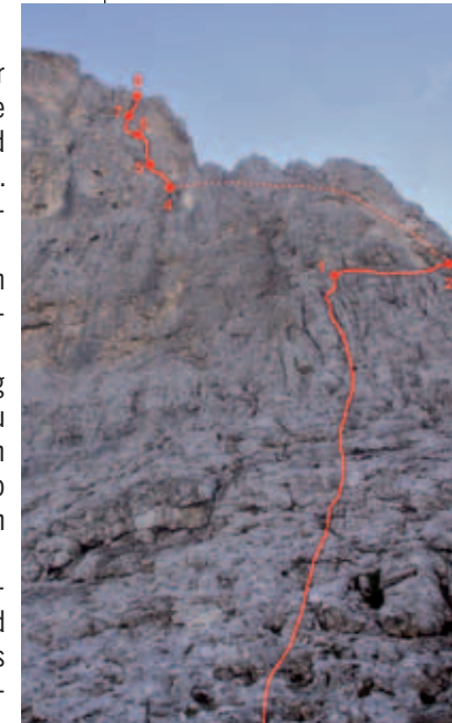
Ansicht der Route vom Einstieg aus