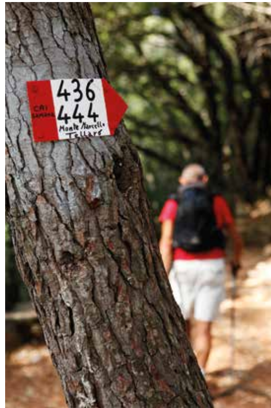
Indicazioni al bivio con il sentiero 444

(indicazioni per Punta Corvo sempre presenti). Senza difficoltà si raggiunge una piccola radura alberata (panche in legno) dove si innesta anche il sentiero 444 che prosegue verso Punta Bianca e Bocca di Magra (chiuso a causa di una frana al momento della pubblicazione di questo libro). Voltando a destra si supera una panchina affacciata sul mare e poi, con una lunghissima serie di gradini, si compie una rapida discesa (che si trasforma al ritorno in una faticosa salita) fino alla sottostante spiaggia, immersi in un bosco