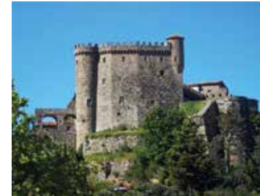
Il Castello di Fosdinovo

“La fama che la vostra casa onora / grida i signori e grida la contrada / si che ne sa chi non vi fu ancora / e io vi giuro, s'io di sopra vada / che vostra gente onrata non si fregia / del pregio de la borsa e de la spada”.