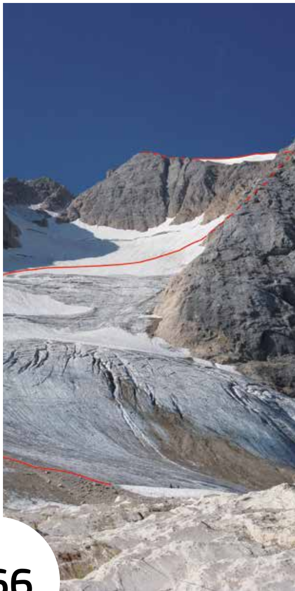
Punta Penia und Marmoladagletscher.