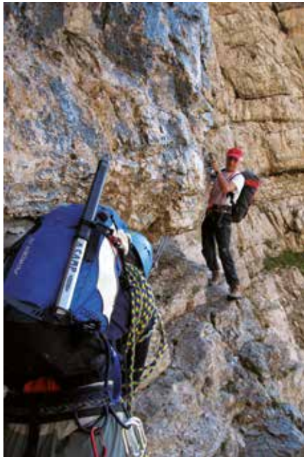
Der Passo del Gatto (Katzenschritt).

ausgesetzter Lage an einem ersten Vorsprung vorbei (1 Ringhaken am Anfang und Sanduhr mit Reepschnur am Ende). Kurz nach der Hälfte des Bandes geht es die zweite, etwas engere Rinne hinunter (1 Hk. mit Reepschnur), mit einem großen Vorsprung und einer kurzen Unterbrechung des Bandes, die leicht überwunden werden kann, indem man sich rechts und links des Vorsprunges an guten Griffen hält oder ein Fixseil nutzt, dass allerdings etwas tief angebracht ist und kontrolliert werden muss. Das Band wird jetzt bis zur dritten Rinne einfacher, wo es schmaler wird und sich die Schlüsselpassage des Aufstiegs befindet, der sogenannte „Passo del Gatto“ (Katzenschritt), ein Felsvorsprung, der ein niedriges Dach über dem Band bildet. Entweder kriecht man durch diese Passage, oder man umgeht sie außen. Sie ist an der sehr ausgesetzten Außenseite mit 4 Haken mit Fixseil gesichert (5 m, II). Nach diesem letzten schwierigen Abschnitt geht es weiter über das