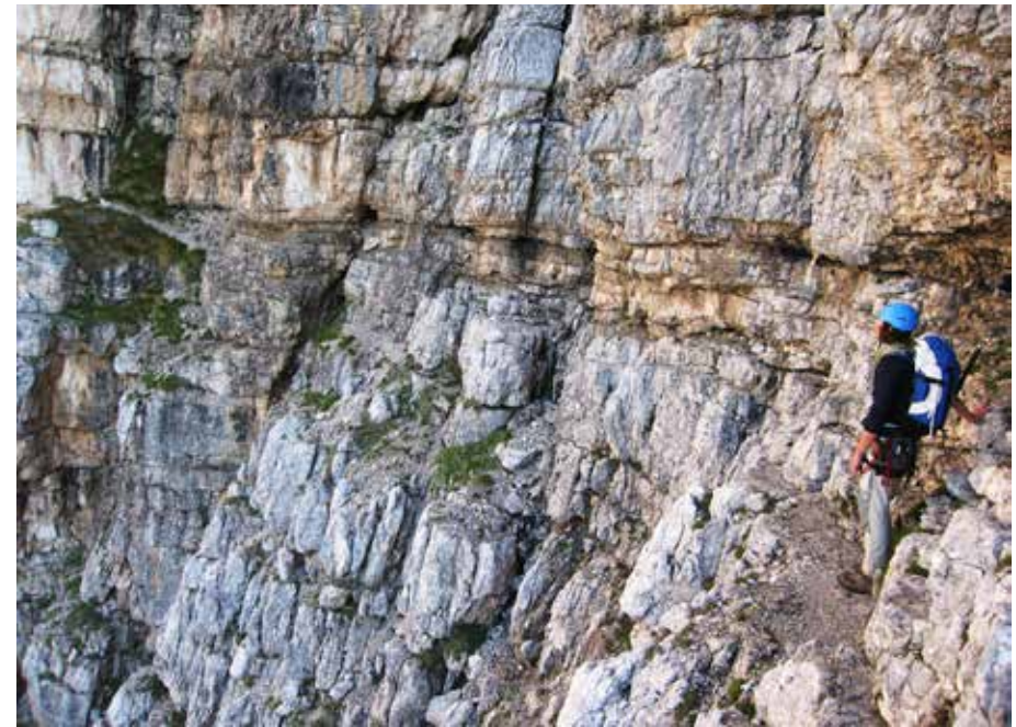
Auf der Cengia di Ball.

Nach einem kurzen Aufstieg erreicht man den Sattel und folgt, anfangs unterhalb des Grats über Bänder und kurze Felsstufen mit Schutt, der Spur und den Steinmännern nach rechts (Nordosten). Weiter oben geht man fast auf der Gratschneide, dann folgt ein kurzer, aber sehr ausgesetzter Abschnitt mit einfachen Kletterpassagen auf der Gratschneide und einem eindrucksvollen Blick links in die Tiefe auf die darunter liegende Nordwestwand (riskant bei starkem Wind).