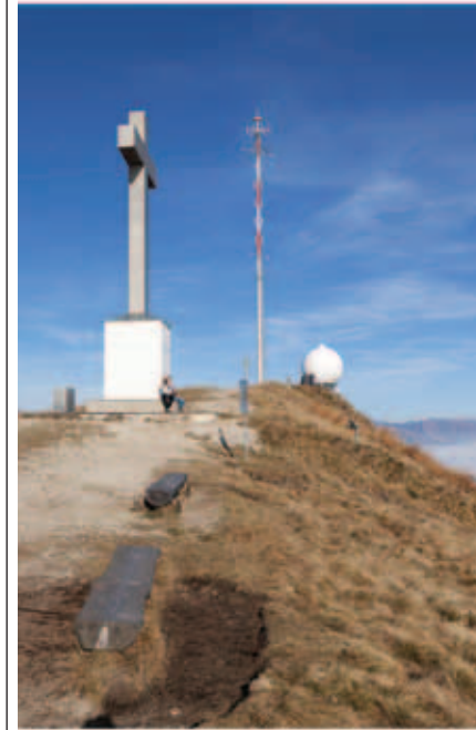
La cima

Salita da Dumenza: percorso molto interessante, segue il tracciato della 3V che inizia poco oltre Trezzino (503 m), cui si giunge proseguendo dritti anziché scendere a sinistra per Curiglia una volta nella piazza di Dumenza. Lasciata a sinistra la deviazione pianeggiante che dirige verso il fiume, si piega a destra seguendo la stretta stradina che si inerpicava brevemente fra le case, per poi pianeggiare e divenire infine sterrata. Ampio spiazzo con teleferica al suo termine. Dal parcheggio, si imbecca il sentiero alla sua estremità, entrando nella Val Cortesel, di cui si costeggia dapprima a destra e poi a sinistra il torrente che vi scorre. Attraversatolo varie volte (attenzione in caso di forti piogge, un paio di ponti traballanti potrebbero risultare sommersi) con suggestivo percorso si giunge all'Alpe Cortesel (708 m), dove il sentiero prende a salire decisamente attraverso fitte faggete. Superati