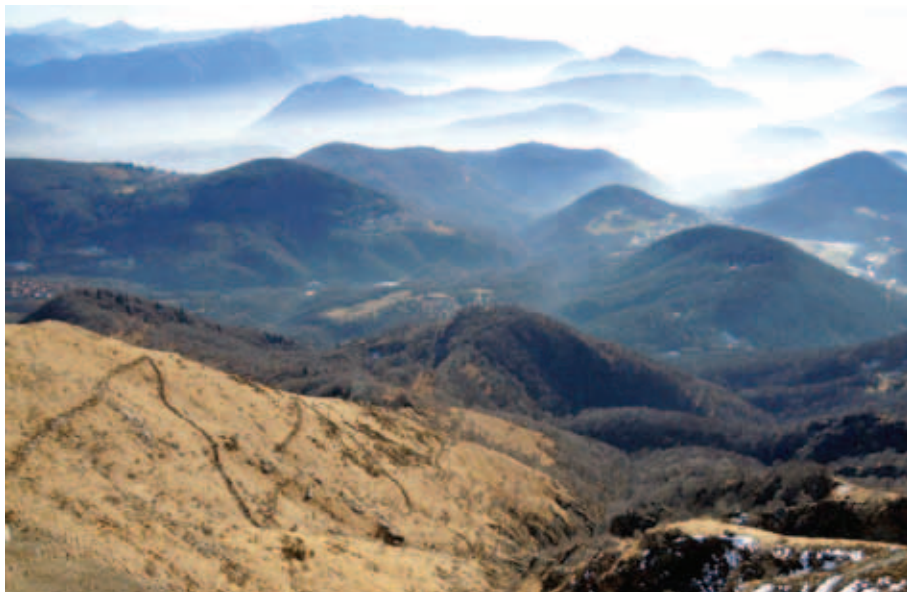
Tratto del sentiero di salita

Presso l'Alpe Pian di Runo la pista effettua uno stretto tornante per puntare a nord ovest e rimontare al culmine della dorsale, lungo la quale si continua lasciando la pista. Per sentiero segnalato la si percorre su blanda pendenza in leggero saliscendi, quindi si affronta l'impennata terminale, a metà circa della quale si trova una panchina con cartelli segnaletici dove si incrocia il sentiero che contorna interamente il cupolone sommitale. Tralasciandolo, si riprende in salita lungo le innumerevoli tracce che affondano nel terreno, sbucando negli ampi pascoli che caratterizzano la calotta terminale. Pochi minuti e si raggiunge la grande croce di vetta. Estesissimo panorama su Ceresio, il Lago Maggiore e le montagne che li circondano. In breve, dalla cima si può scendere alla stazione di arrivo dell'ovovia che sale da Miglieglia, dove si trova il bar ristorante.