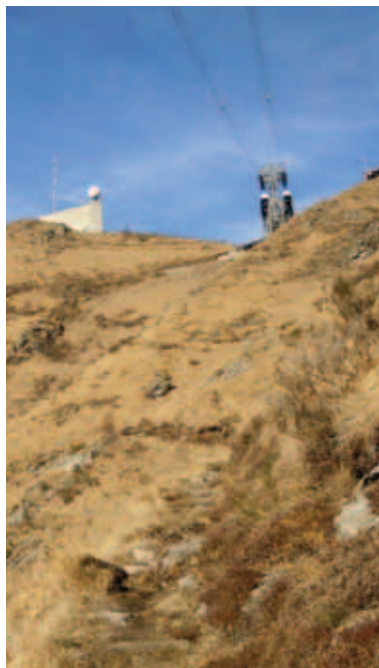
Verso la cima